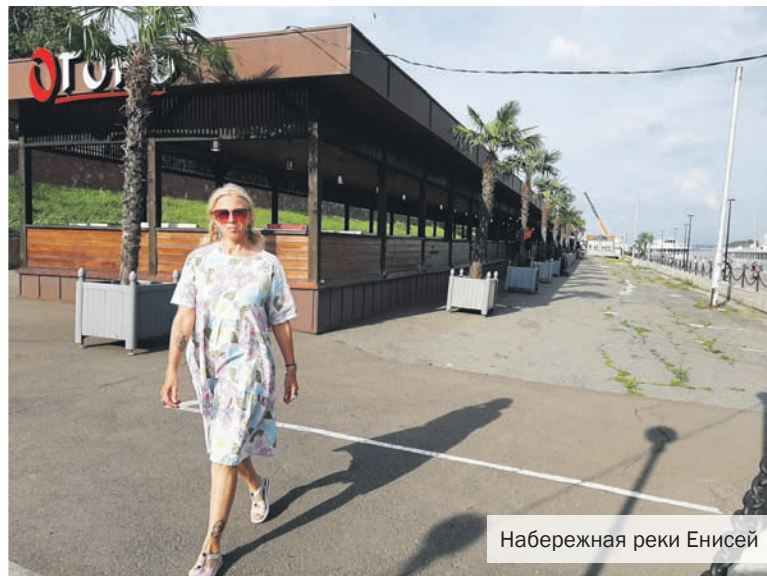
Набережная реки Енисей

Какой российский город не хочет занять что-нибудь самое-пресамое? Порой кажется, что все эти «самые» уже давно разобраны. Но красноярцы, любящие родной город очень деятельно, всё равно постоянно находят, чем удивить и порадовать себя и своих гостей.