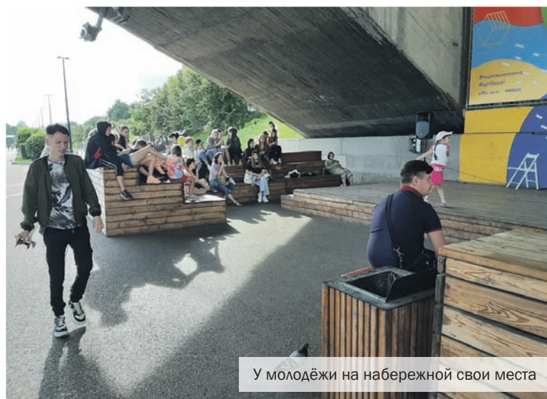
У молодёжи на набережной свои места