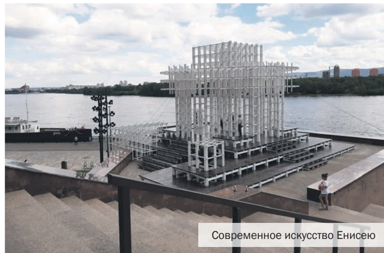
Современное искусство Енисею